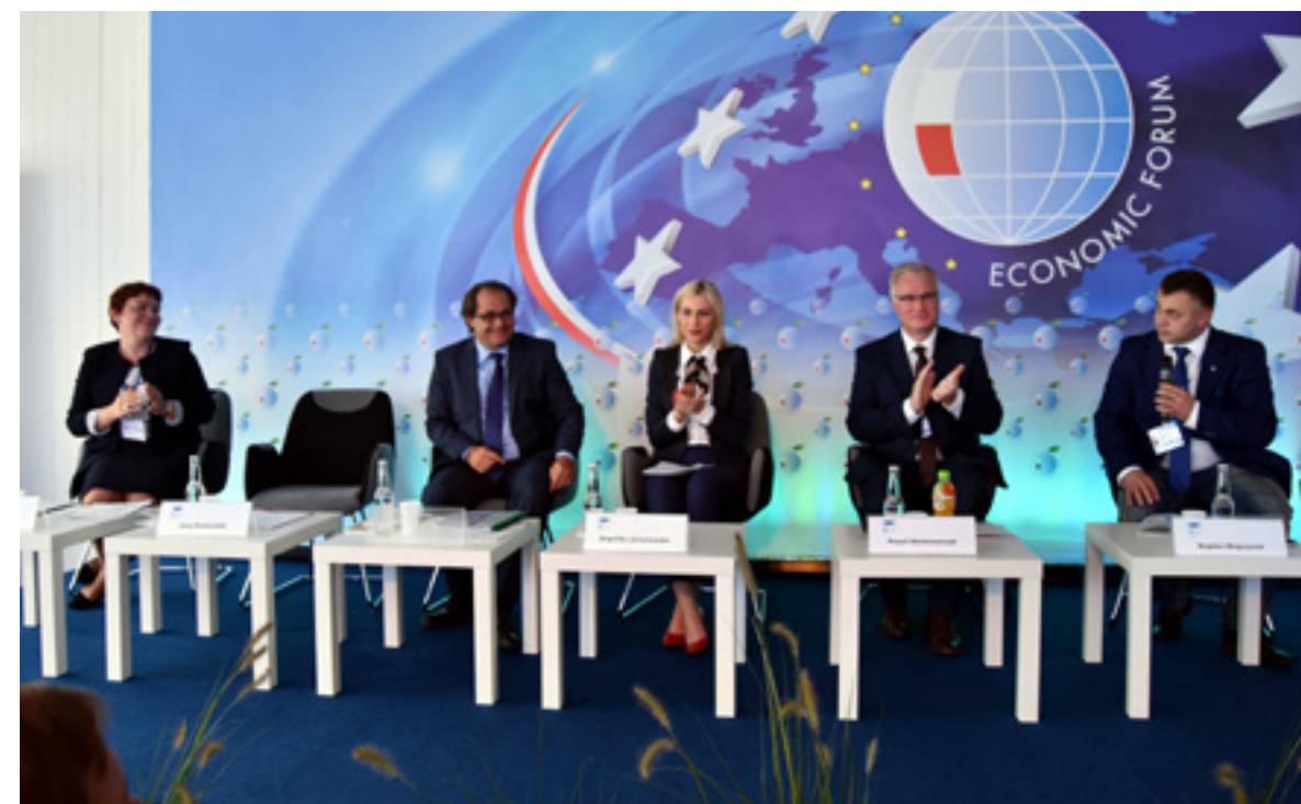
Debata Programu POLSKA 3.0. Program wspólnie omawiali: minister gospodarki morskiej i żeglugi śródlądowej, przedstawiciele Komisji Europejskiej i ONZ-owskiej Konwencji AGN, do której przystąpienie było niezbędnym działaniem w kierunku modernizacji żeglugi śródlądowej.

Prestiż: Premier Eugeniusz Kwiatkowski, wybitny ekonomista i gospodarczy pragmatyk uważał, że polską gospodarkę trzeba sieciować, tworzyć ośrodki przemysłu i uruchomić transport wodny. Czy POLSKA 3.0 może stać się takim nowym, współczesnym Centralnym Okręgiem Przemysłowym?