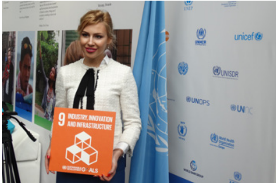
Program POLSKA 3.0 reprezentował nasz kraj na European Development Days w Brukseli.

Poprzez budowanie kultury zaufania klastry jako organizacje otoczenia biznesu pozwalają wykorzystać efekt synergii, przygotowywać innowacyjne projekty w kooperacji z przemysłem i biznesem, a w efekcie – ich komercjalizację.